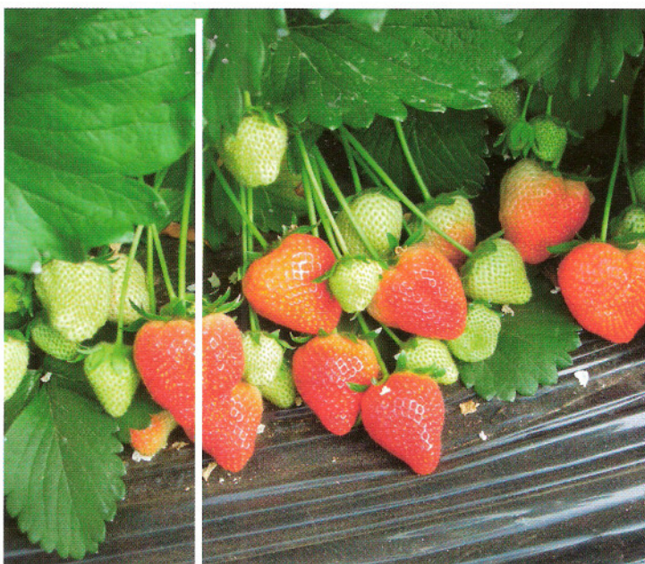
Figaro geeft aanzienlijk minder kleine en misvormde aardbeien, waardoor het plukrendement hoger is dan van Elsanta.

In de zomer van 2006 werd Figaro op een beperkt aantal proeflocaties gezet. De vruchten bleven dikker en harder dan bij Elsanta. De tragere weggroei en de minder vlugge doorleuning van de wat meer oranje-helrode vruchten van Figaro waren in deze warme zomer een voordeel. Afgelopen zomer lagen er grotere proefplantingen rond Breda en Hoogstraten. Koel, nat weers bleek niet het ideale klimaat voor Figaro, hoewel een aantal voordelen van dit ras toch naar voren kwam.